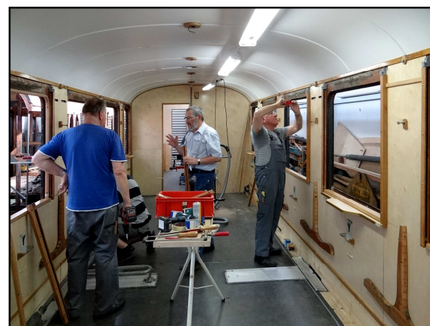
Innenausbau wie neu