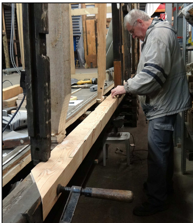
Ersatz eines vermoderten Teiles des Bodenbalkens