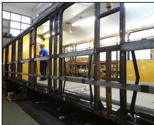
Der Kasten des AB 4453 wurde ausgeräumt und ausgebleicht

Die beiden Drehgestelle wurden komplett zerlegt, gereinigt und neu lackiert. Alle Federpakete sind zerlegt und neu gefettet worden, alle Schraubenfedern an den Achslagern durch neue ersetzt. Die Gleitflächen der Drehgestelle und der Federung wurden durch wartungsfreie Kunststoffgleitflächen ersetzt.