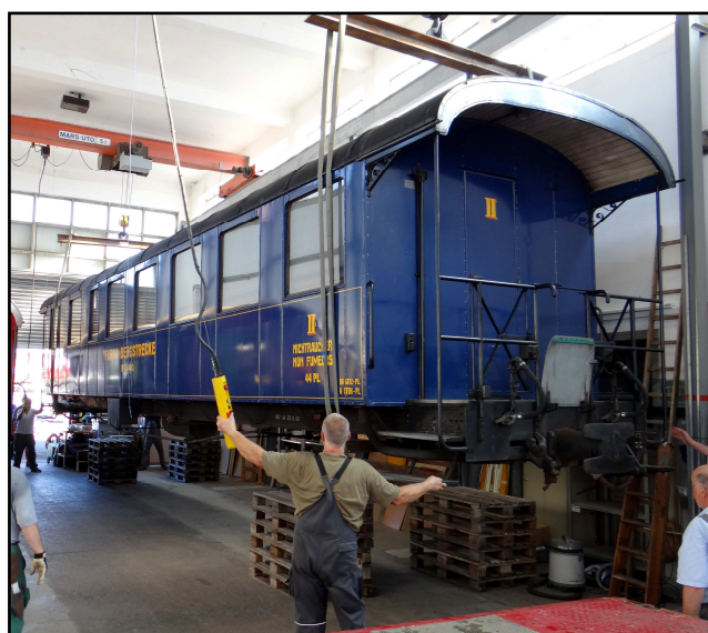
Ankunft des AB 4453 in der Wagenwerkstatt Aarau

Der AB 4453 war nach einer Totalrevision in der Wagenwerkstatt Aarau im Jahr 2000 der Dampfbahn Furka-Bergstrecke als B 4253 (alle Sitzplätze 2. Klasse) für den Fahreinsatz abgeliefert worden. 2008 wurde das kleinere Abteil mit Sitzen 1. Klasse ausgerüstet, um der Nachfrage zu entsprechen. Dies führte zur Umbezeichnung in AB 4453. Nach 16 Jahren Einsatz auf der Bergstrecke - ganzjährig dem rauen Bergklima ungeschützt ausgesetzt - wurde es nötig, den Wagen grundlegend zu revidieren (Revision R4).