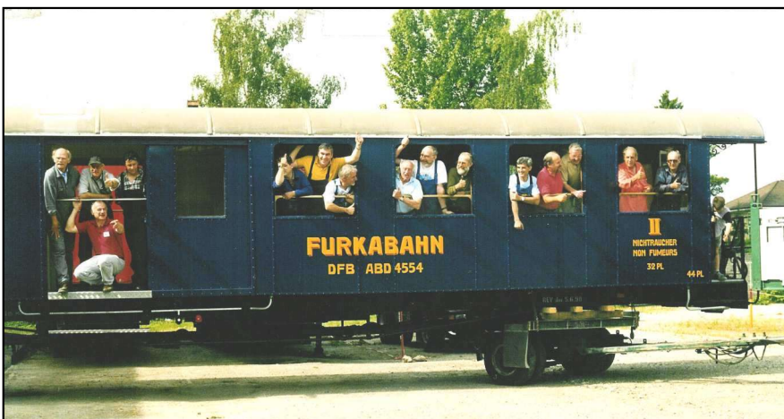
Mit Stolz im ersten Aargauer Wagen vor dem Transport nach Realp

Im letzten Teil der Revision schraubten wir die alten aufgearbeiteten kobaltblau lackierten Bleche mit allen Deckleisten wieder an den imprägnierten Holzkasten. Das Alu-Blechedach, zur Kontrolle entfernt, wurde wieder montiert und mit Dachpappe nach unten abgedichtet. Schlussarbeiten wie Wagenbeschriftung und tausende von irgendwelchen (nötigen) Deckleisten und die Sponsorentafeln rundeten unser erstes Werk ab.