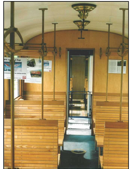
Die vollständig neue Inneneinrichtung

elektrischen Beleuchtung und einer Lautsprecheranlage.