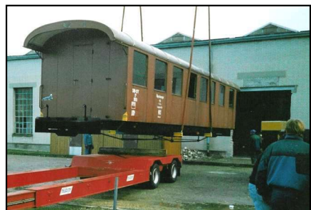
Der Wagenkasten schwebt in die Aarauer Werkstätte ein

In der damaligen Werkstätte Goldau wurde zuerst der hölzerne Wagenkasten abgehoben und das darunter liegende Chassis mitsamt seinen Drehgestellen in die Werkhalle