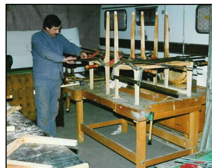
Holzbänke von Grund auf hergestellt

Wie schon erwähnt, besass der Wagen keine Inneneinrichtung mehr. Alles war neu herzustellen