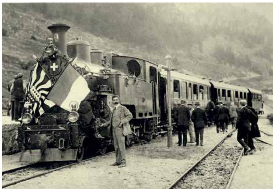
Eröffnungszug mit Lok 9 auf der Rückfahrt von Gletsch nach Brig beim Zwischenhalt in Oberwald.

Amüsant, wie die NZZ am 2. Juli 1914 über die erste Abfahrt der HG 3/4 Nr. 9 in Oberwald schreibt. Da sind keine technischen Daten, keine Zahnstangen, keine Zahnräder erwähnt, hingegen viel Romantik in epischer Breite. Schwulstig aus heutiger Sicht. «Es passt ganz zum schweigsamen, zurückhaltenden Wesen seiner trotzigen Bewohner, dass sie der Lokomotive mit sehr gemischten Gefühlen entgegensehen, ...» Oder «Die Sonne, die das Feuer in den Dôle strahlt, brannte vom wolkenlosen Himmel herab, als die Züge die festliche Fahrt antraten.» Köstlich auch das fast krampfhaft Suchen nach Synonymen: «Von Gletsch bis Andermatt ist eine Fahrzeit von 1 ½ Stunden vorgesehen , bis Di-