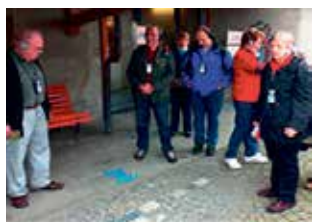
Der blaue Punkt als Wegweiser

Ein längeres Traktandum war die Anpassung unserer Vereinsstatuten an die Statuten des Dachverbandes VFB. Der Zentralvorstand ist mit den Ergänzungen (die Anpassung der Mitgliederkategorien, eine Korrektur bei Beendigung der Mitgliedschaft und die Regelung der Verantwortung über die Mitgliederbeiträge) einverstanden. Es war ein kurzweiliger Abend. Zur Verbesserung des Netzwerkes hätte sich der Vorstand noch mehr Teilnehmer an den Vereinsanlässen gewünscht. Unsere Sache hat nur Bestand, wenn wir nach der abgeschlossenen Pionierphase auch in Zukunft für den Erhalt der Dampfbahn den dazu erforderlichen Nachwuchs begeistern können.