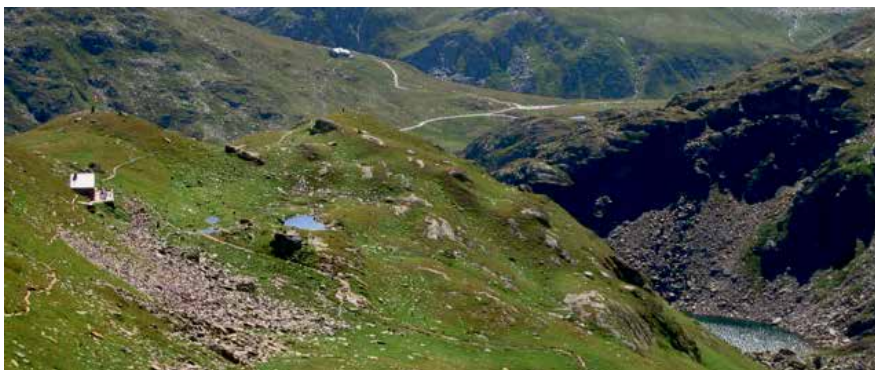
Situation: Links Badushütte, unten rechts der Tomasee und hinten das Maighelstal mit der Maighelshütte

Viele Wanderer steigen nachher ab und einige bleiben, da sie vom Charme der Hütte angetan sind. Günstig kann man im Massenlager (22 Plätze) übernachten und kuschelt sich in die warmen Daunendecken.