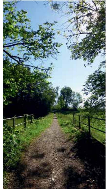
Der Wanderweg folgt dem alten Trasse und überquert einen Viadukt

Da die Wetzikon-Meilen-Bahn, wie auch die Uster-Oetwil-Bahn und die Uerikon-Bauma-Bahn technisch veraltet waren, schlug eine Kommission vor, diese Bahnen durch einen Autobusbetrieb zu ersetzen. Sofort bildete sich ein Aktionskomitee für die Erhaltung der Bahnen im Zürcher Oberland. Am 18. März 1946 genehmigte der Kantonsrat aber seinen Beitrag für die Reorganisation der drei Bahnen im Zürcher Oberland, Aufhebung der Bahnen und Einrichtung von