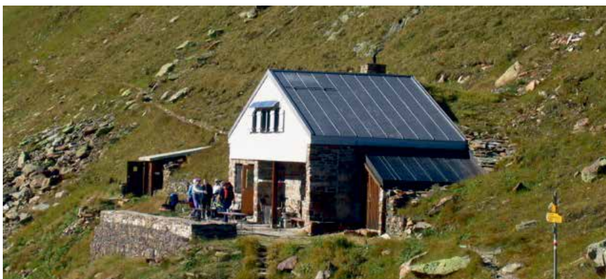
Die Badushütte liegt auf 2500 m