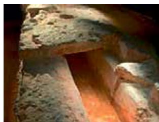
«Aquaeductus» Funktionstüchtige römische Wasserleitung

Im Jahre 1903 wurde der römische Schutthügel von 200 m Länge und 18 m Höhe entdeckt. Die darin gefundenen gut erhaltenen Holzbalken, Baumaterialien und Werkzeuge entstammen von Abbrüchen von damals nicht mehr benötigten Bauten. Weitere Entdeckungen waren das Nordtor, das Amphitheater, der Palast des Legionskommandanten sowie die Küche eines römischen Offiziers usw. Erst im Jahre 1935 wurde die 2,4 km lange Wasserleitung von Hausen nach Windisch entdeckt.