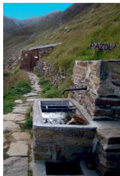
Hier fliesst sehr kaltes, aber sauberes Rheinwasser, die Toilette wird ebenfalls mit Rheinwasser gespült

Reservierungen: reservation@badushuette.ch oder 032 512 83 84