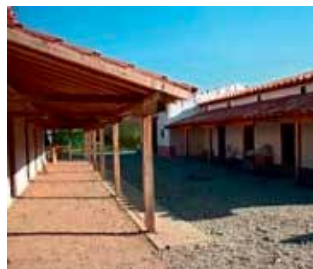
«Contubernia» Standlager der römischen Armee

Mit einem Audioguide bewaffnet machten wir uns nun auf die Tour. Die Führung dauerte rund zwei Stunden. Es gab viel Neues zu hören, entdecken und zu bestaunen. In Vindonissa bereiteten sich einst die Legionäre auf ihre Einsätze vor, unter der Herrschaft des römischen Kaisers als ihr Auftraggeber.