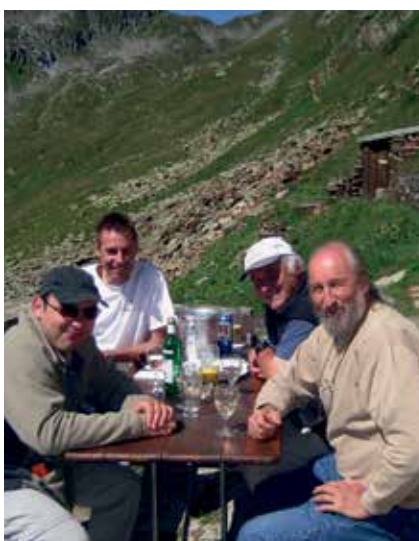
Gemütliches Zusammensein auf der Sonnenterrasse

Reservierungen: reservation@badushuette.ch oder 032 512 83 84