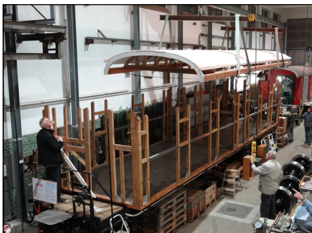
Das vormontierte Dach schwebt auf das tragende Gerippe des Wagenkastens

neuer Kasten gemäss den Originalplänen gebaut. Alle Holzteile dafür haben die Mitarbeiter der Wagenwerkstatt neu gefertigt: Eine aufwendige Arbeit, die eine gute Arbeitsvorbereitung und hohe Präzision erforderte, damit am Ende alle Teile genau zusammenpassten. Tag der Wahrheit war der 24. November 2015, an dem in weniger als zwei Stunden das Dach auf die unzähligen Pfosten des Wagenkastens aufgesetzt wurde.