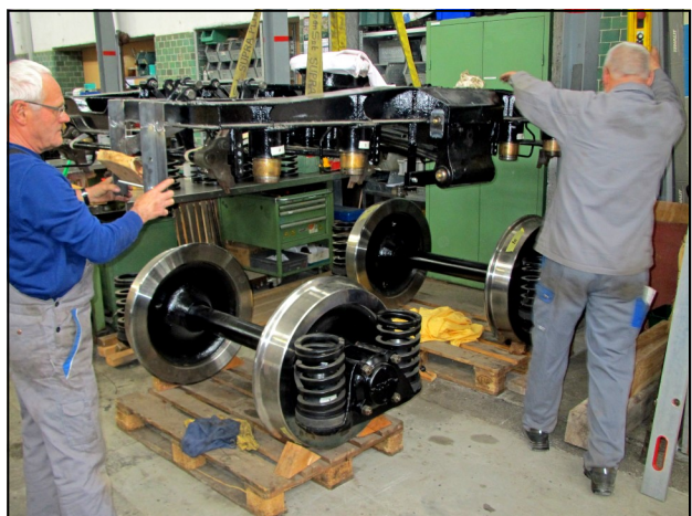
Aufsetzen des revidierten Drehgestellrahmens auf die neu bandagierten Radsätze

Der Bodenrahmen, alle Teile des Bremssystems und die Drehgestelle wurden von Grund auf revidiert, d.h. zerlegt, alle Teile gereinigt, überprüft, wo erforderlich überarbeitet oder ersetzt, mit Schutzanstrich versehen und wieder zusammengebaut. Die Räder der Drehgestelle wurden neu bandagiert und die Bremszahnäder und Bremsstromeln durch neue ersetzt.