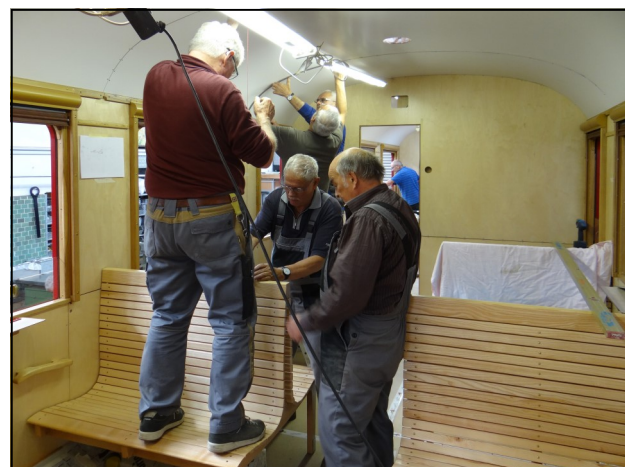
Schlussmontagen in der 2. Klasse: Bänke, Gepäckträger und eine Unzahl von Abdeckleisten

Neu gefertigt wurden unter anderem die Dampfheizung, die elektrische Ausrüstung für die Beleuchtung mit Generator und Akku und eine Lautsprecheranlage.