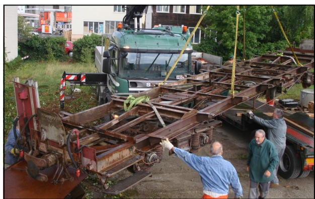
Der Wagenrahmen wird zur Revision vom Zwischenlager geholt

Ein wesentlicher Unterschied ist die Einteilung der Abteile und die Ausrüstung mit Sitzplätzen. 1914 galt noch das Drei-Klassen-System mit der 1. Klasse in 1+2-Bestuhlung gepolstert, der 2. Klasse mit 2+2-Bestuhlung gepolstert und der 3. Klasse mit 2+2-Bestuhlung Holz. Der AB 4462 hat anstelle der Sitze 1. und 2. Klasse des AB 453 18 Sitzplätze 1. Klasse gepolstert und 28 Sitzplätze 2. Klasse Holz.