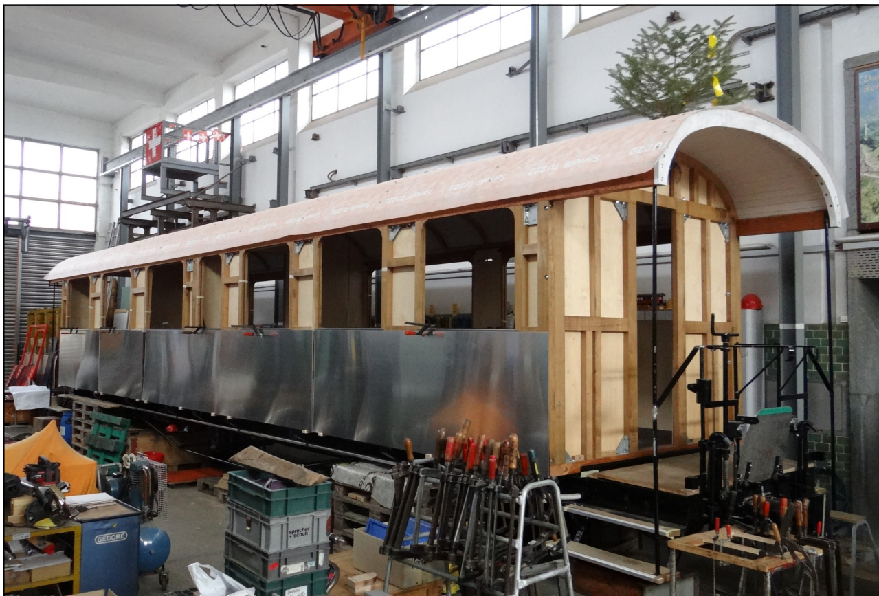
Der AB 4462 in der Wagenwerkstatt Aarau mit aufgesetztem Dach und ersten probeweise angeschlagenen Blechen.

Nachdem der alte Wagenkasten abgebrochen war, wurde ein komplett